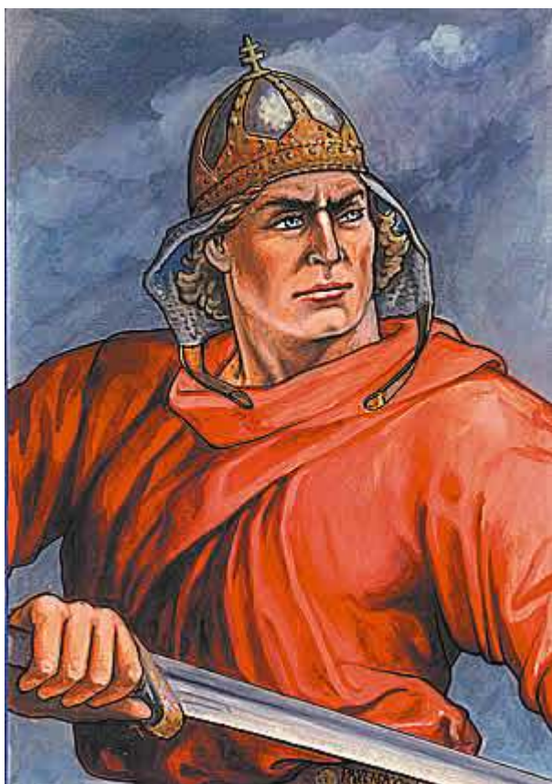
Kňaz-král Slavomír (A.D. 871)