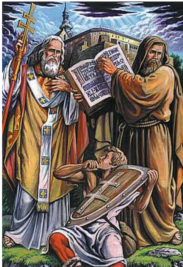
Patróni Európy, svätci Cyril (A.D. 827-869) a Metod (A.D. 815-885), zostavovatelia slovenskej abecedy-hlaholiky a prví kodifikátori slovenčiny, šíрили kresťanskú náuku v Slovenskej zemi.